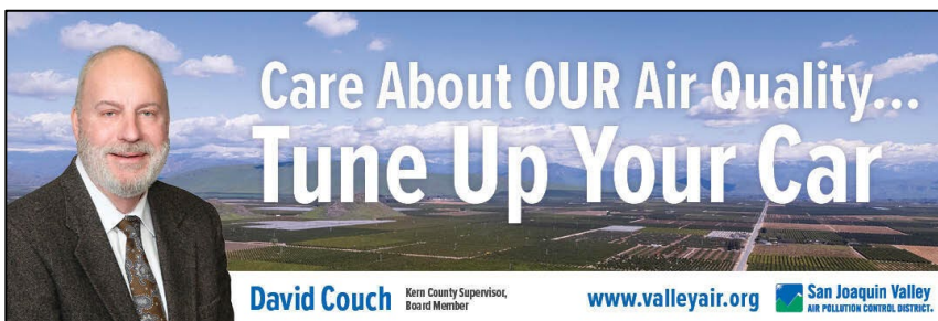
Ejemplo de vallas publicitarias

El Distrito ha utilizado durante mucho tiempo medios impresos, radio, televisión y publicidad exterior en sus exitosas campañas de alcance. Estos medios proporcionan información directamente a las comunidades a través de métodos tradicionales y esperados. El Distrito se beneficia de relaciones bien establecidas con los meteorólogos del Valle y la información sobre la calidad del aire que comparten en sus segmentos meteorológicos de las noticias nocturnas de televisión y las noticias transmitidas por radio local. Aunque existen muchos medios nuevos, los métodos tradicionales de alcance siguen desempeñando un papel en el alcance del Distrito. El Distrito también aprovecha las relaciones con los medios de comunicación, incluidos periodistas y programas de asuntos comunitarios en todo el Valle, para generar cobertura sobre oportunidades de subvenciones y progreso en la calidad del aire que ocurre en el Valle.