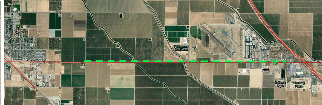
Site #2/ Sitio #2 : Lerdo Highway