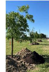
Urban Greening Ecologización Urbana