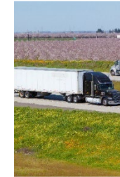
Heavy-Duty Truck Rerouting Desviación de Camiones de Servicio Pesado