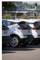
Public Fleet Vehicles Vehículos de Flotilla Pública