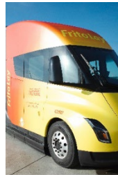
Heavy-Duty Trucks Camiones de Servicio Pesado