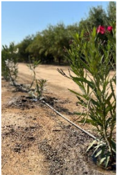
Vegetative Barriers Barreras Vegetativas