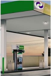
Alternative Fueling Stations Estaciones de Servicio de Combustible Alternativo