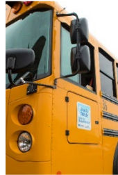
Electric School Buses Autobuses Escolares Eléctricos