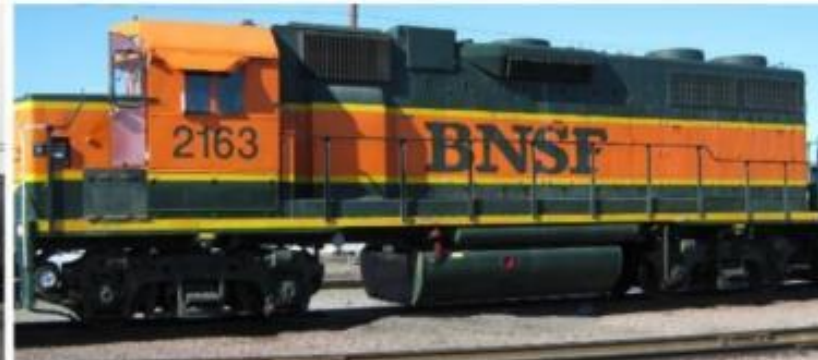
Locomotoras de Pasajeros y de Carga