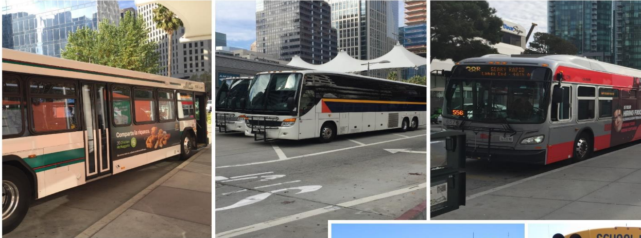
Autobuses Escolares y de Tránsito