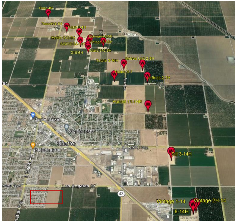
Figura 2: Mapa de los 18 pozos inspeccionados