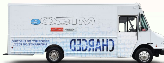
Advanced Clean Trucks / Camiones Limpios Avanzados