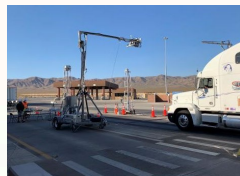
Heavy-Duty Inspection & Maintenance / Inspección y Mantenimiento de Vehículos de Uso Pesado