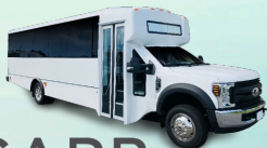
Zero Emission Airport Shuttle / Servicio de Enlace con el Aeropuerto de Cero Emisiones