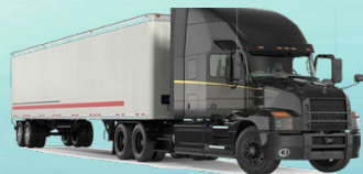
Heavy-Duty Omnibus / Ómnibus de Servicio Pesado