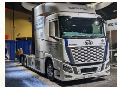
Zero-Emission Truck Measure / Medida de Camiones de Cero Emisiones