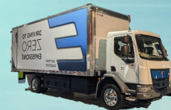
Advanced Clean Fleets / Flotas Limpias Avanzadas